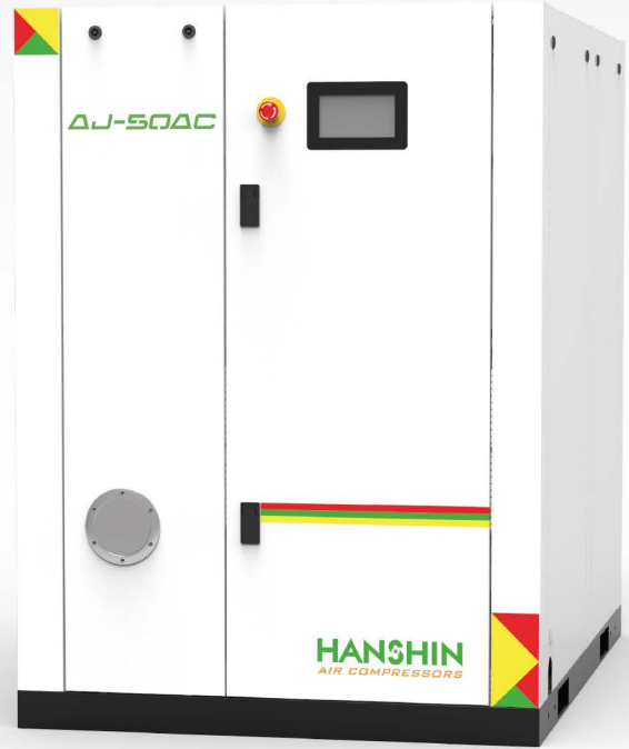
AJ- 50AC - PM MOTOR TYPE

정속형 모델 대비, 8% 절감 연간 절감액 350만원 (50HP, 부하율 85%, 전기요금 132원 기준)